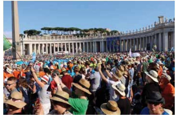
Papstaudienz am Petersplatz