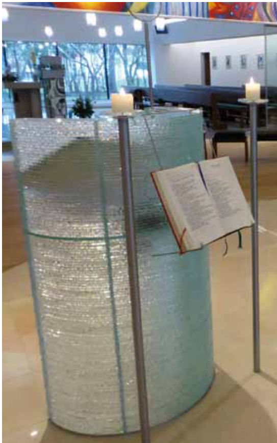
Ambo in der Pfarre St. Johannes Kapistran

Bereits in frühchristlichen Zeiten wurden Gemeindemitglieder, die lesen konnten, zu diesem Dienst während der Messe herangezogen. Im Laufe der Jahrhunderte wurde dann der Lektorendienst alleinige Aufgabe angehender Geistlicher.