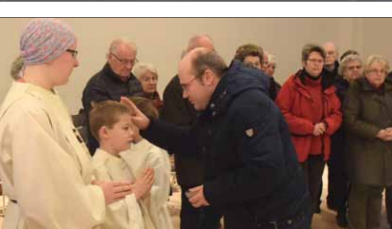
Beginn der Fastenzeit mit dem Aschenkreuz