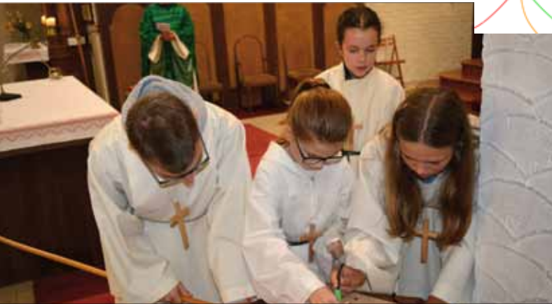
Ministrantenmesse zum Thema „Offener Kreis“