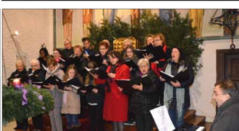
... und dem Kirchenchor des Pfarrverbandes