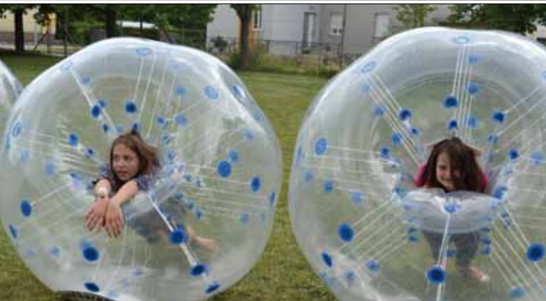
Spiel und Spaß für Groß und Klein ...