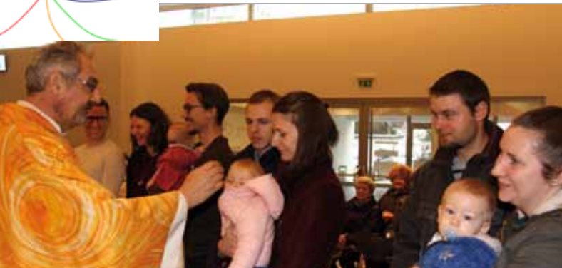
Taufkindersegnen des Pfarrverbandes in der Pfarre St. Johannes Kapistran