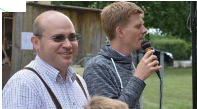
„Herzlich Willkommen beim Pfarrfest“