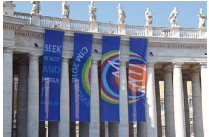
Motto und Logo der Ministrantenwallfahrt 2018