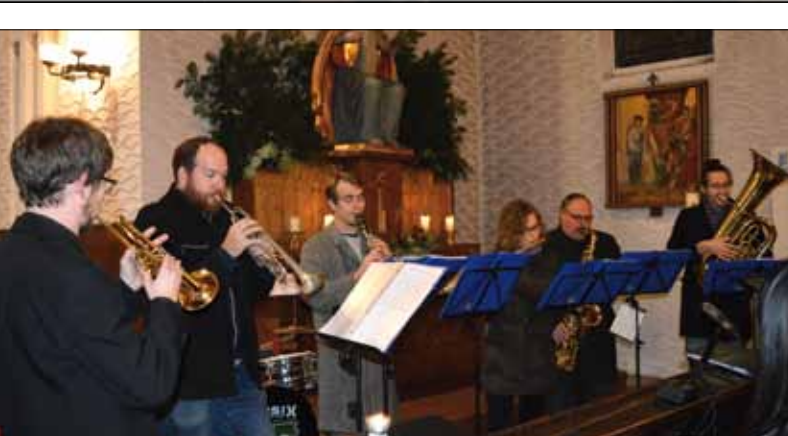
Adventkonzert mit den „GAFFER“ ...