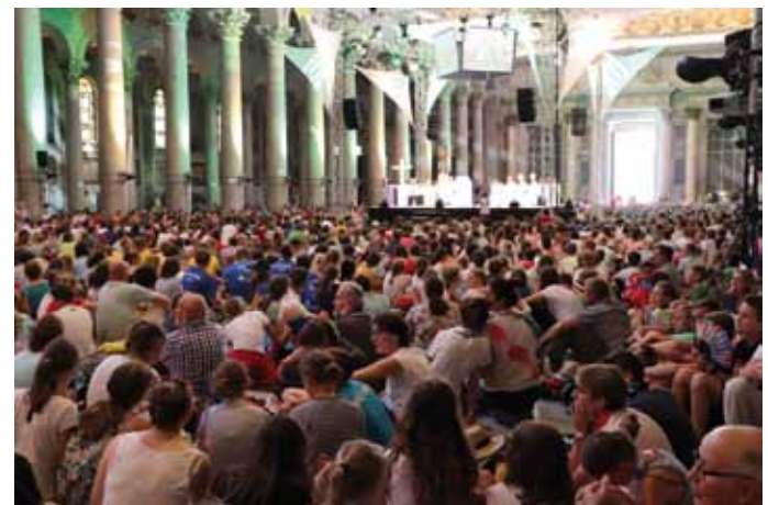
Gemeinsame Messe aller österreichischen Ministranten